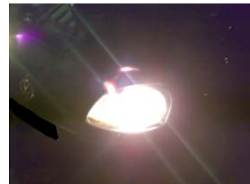
OSRAM Nightbreaker H7