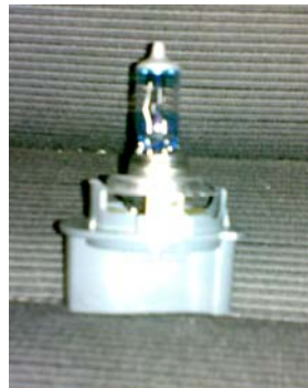
OSRAM Nightbreaker H7 in der Halterung