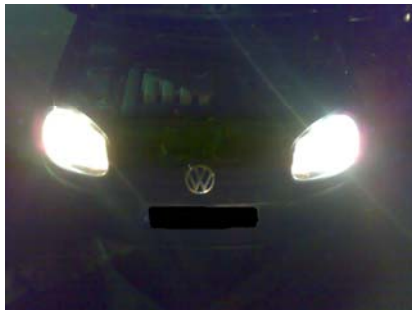
Im Bild links die alte Glühlampe, rechts OSRAM Nightbreaker H7