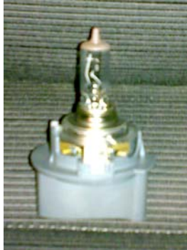
Alte Glühlampe in der Halterung

4.) Glühlampenhalterung (1.) vorsichtig gegen den Uhrzeigersinn aufdrehen und mitsamt Glühlampe herausnehmen