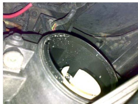
...und hier muss Halterung mit Glühlampe wieder rein

5.) Glühlampe mitsamt OSRAM Nightbreaker H7 wieder in die Vorrichtung drehen und Verschlusskappe wieder zuschrauben