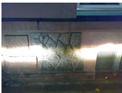
Leuchtkraft links von OSRAM Nightbreaker H7, rechts von der alten Glühlampe