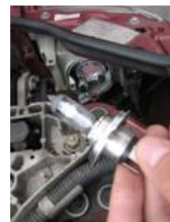
Arretierung lösen, Metallhebel umklappen