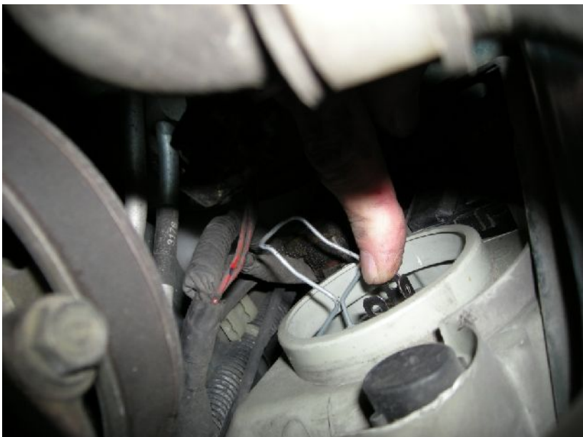
neue Lampe einsetzen