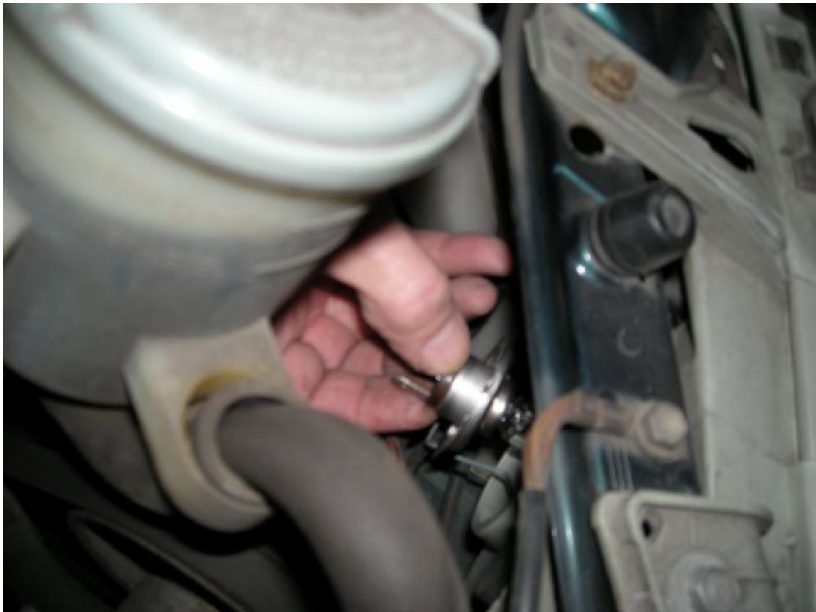
Klammer öffnen, Lampe entfernen