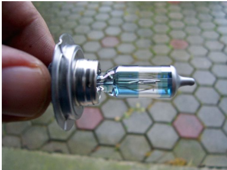
Der OSRAM NIGHT BRAKER, aber nur außen am Sockel anfassen!