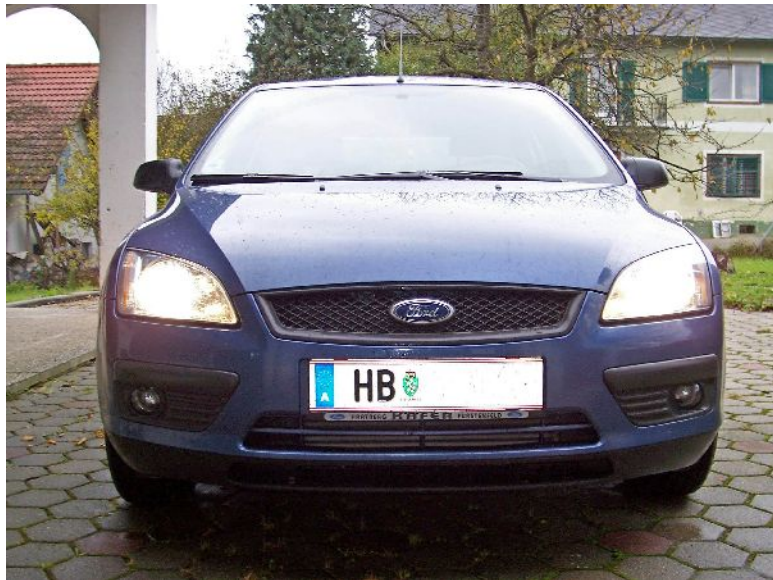
jetzt "strahlt" er wirklich!