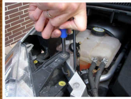
Die erste Schraube am Scheinwerfer wird gelöst