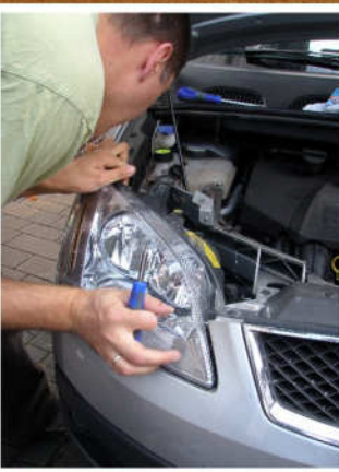
Der Scheinwerfer wird eingesetzt