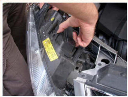
Die Schutzkappe wird abgenommen