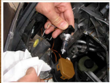
Die neue Birne von OSRAM