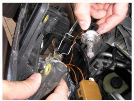
Die alte Birne