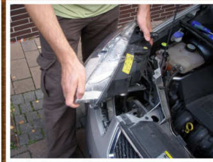
Der Scheinwerfer wird rausgenommen