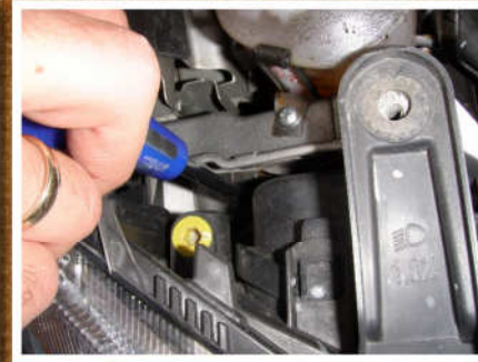
Die zweite Schraube am Scheinwerfer wird gelöst