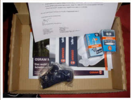
Das Päckchen ist da!