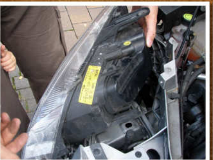
nun wird alles wieder zusammgebaut und eingesetzt